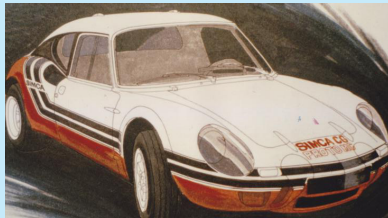
Dessin d'étude de Jean Gessalin du Proto MC 1970.

Les différents modèles de la gamme y sont représentés, à savoir les 1000, 1200 s et 1300, tant en coupés qu'en cabriolets. En plus de ces modèles de tourisme quelques adhérents possèdent des prototypes dits « 548 » destinés à la compétition ainsi que d'autres rares et authentiques spiders montagne produits et transformés à l'usine de Brie-Comte-Robert.