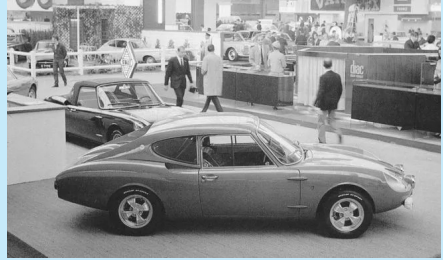
Stand CG au salon de l'auto 1967.

En 1954, ils découvrent l'usage du polyester pour la réalisation de carrosseries (procédé et matériaux importés des U.S.A.).