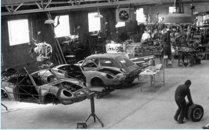
Vue de l'usine de Brie-Comte-Robert.